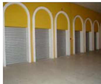
Cortinas de ferro darão segurança aos expositores

Conforme Maura, também começarão as obras que trocarão as calhas da Praça de Alimentação e a revisão de toda a parte elétrica interna e externa do Centro de Eventos. O piso do pavilhão central será pintado e algumas irregularidades serão corrigidas.