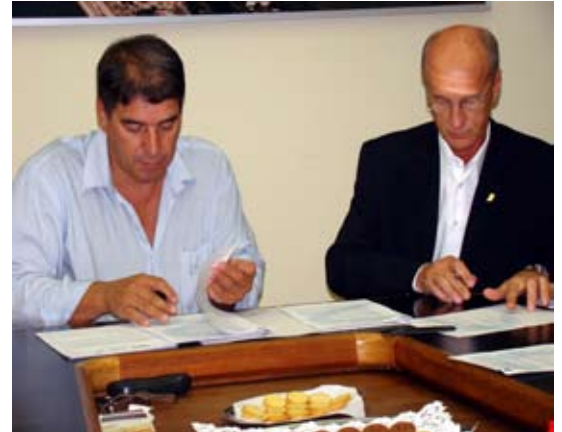
Presidentes das duas entidades firmam parceria