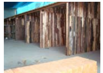
Novos estandes na Estância Princesa do Sul