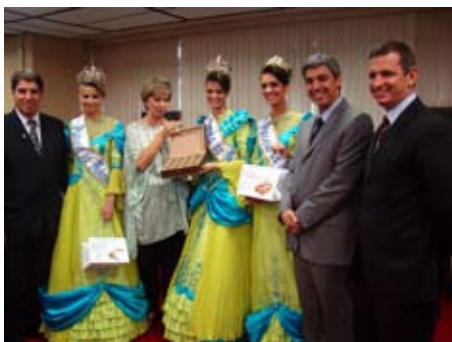
Governadora recebe convite oficial