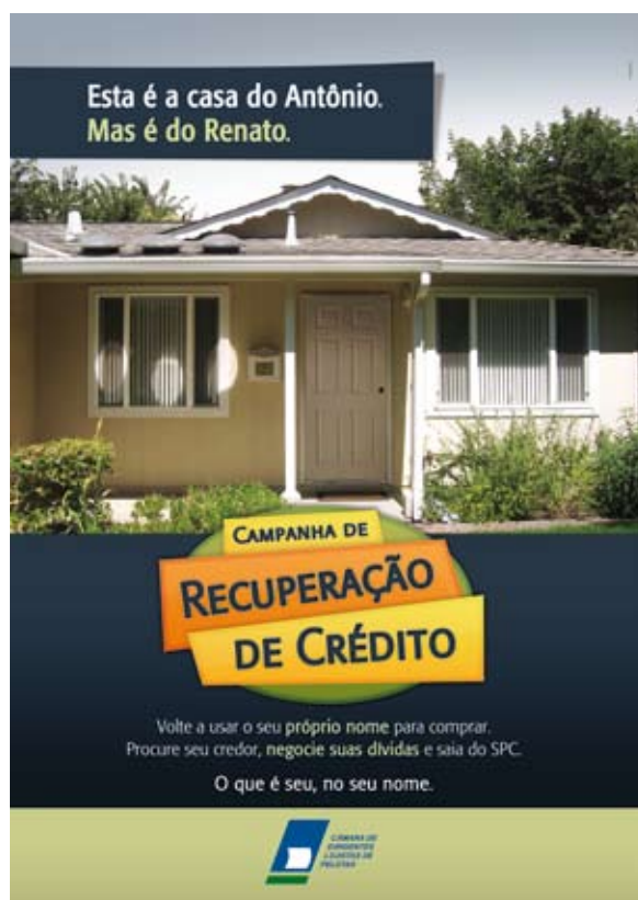
Cartaz que foi entregue aos associados da CDL Pelotas